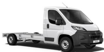
Biela Icy - pastelová (PRP0)