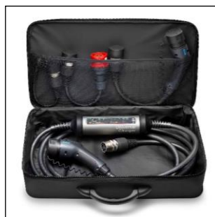
Súprava s nabíjacou jednotkou pre zapojenie do viacerých druhov elektrickej siete (230V/400V/WallBox)