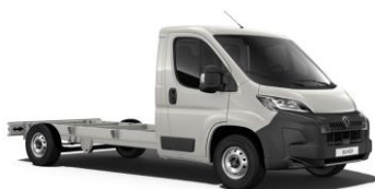
Sivá Expedition - pastelová (4KP0)