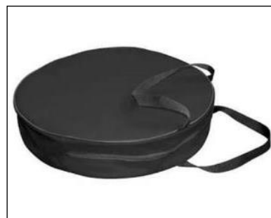
Taška na nabíjacie káble