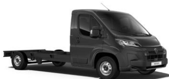
Sivá Graphito (čierna) - metalická (E9M0)