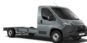
Sivá Tonnere - pastelová (2BP0)