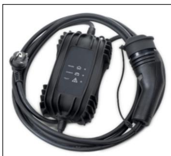
Štandardný kábel pre zapojenie do domácej 230V zásuvky