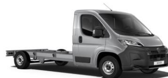
Sivá Artense - metalická (F4M0)

BUFX - látkové čalúnenie čierne Creppe Medium