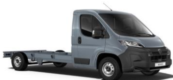
Sivá Iron - metalická (ZWM0)