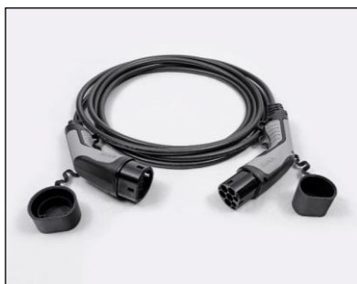
Kábel režimu 3 pre pripojenie do nabíjacej stanice (domáceho WallBoxu alebo verejnej stanice)